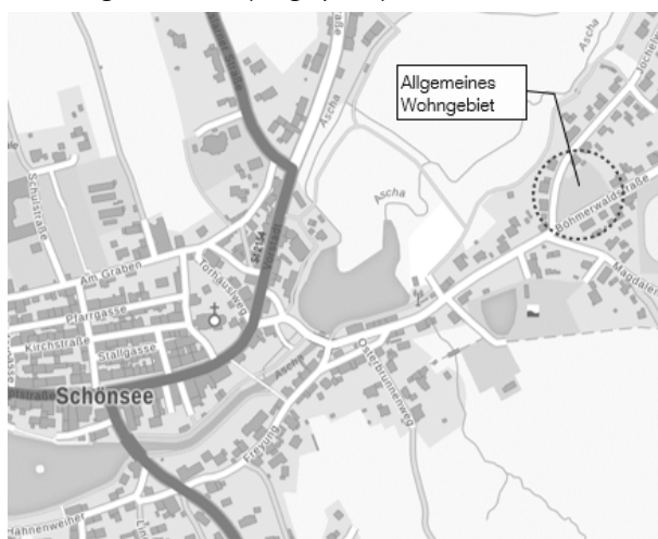
Ausschnitt Bayernatlas : © 2021 Bayerische Vermessungsverwaltung