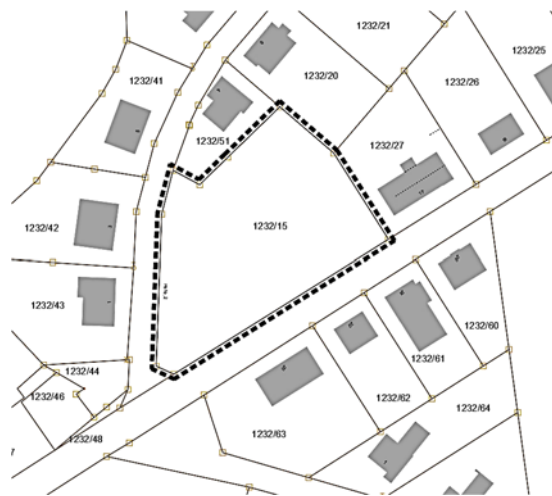
Ausschnitt ALKIS® mit Umgrenzung Geltungsbereich; Geobasisdaten: Bayerische Vermessungsverwaltung

Der räumliche Geltungsbereich des aufzustellenden Bebauungsplans kann im Rathaus, Hauptstr. 25, Schönsee, (Bauamt, Herr Jeitner), während der üblichen Öffnungszeiten (Mo - Fr: 08.00 - 12.00 Uhr; Mo, Di, Do: 13.00 - 16.00 Uhr) bzw. auf der Internetseite der Stadt unter ( www.vg-schoensee.de/rathaus/bauen-und-wohnen/baugebiete.html ) eingesehen werden.