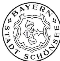
Kreuzer 1. Bürgermeister Stadt Schönsee