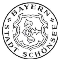
Kreuzer 1. Bürgermeister Stadt Schönsee